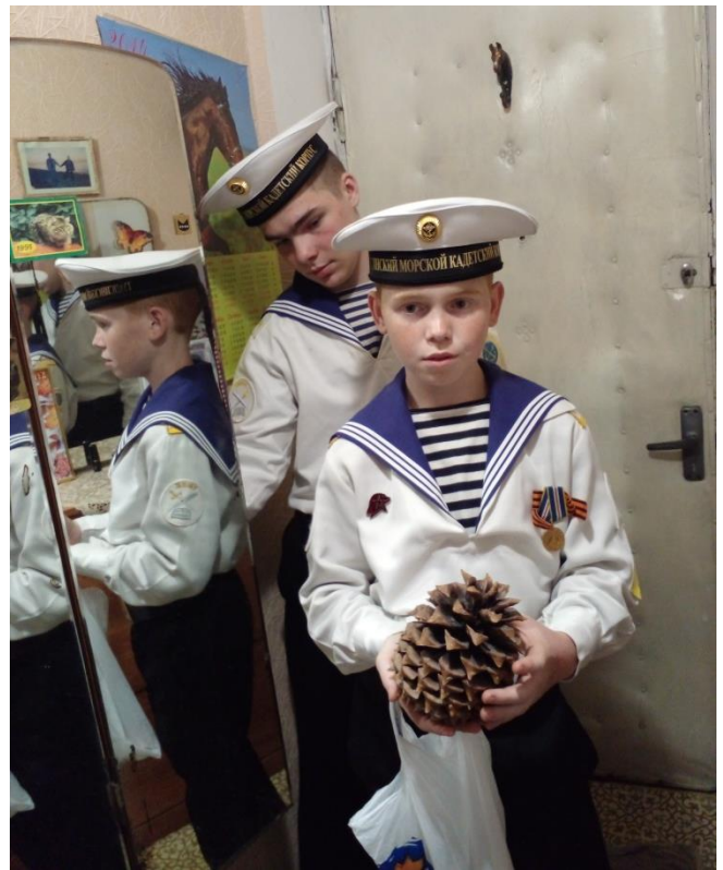
Воспитатель 22 группы